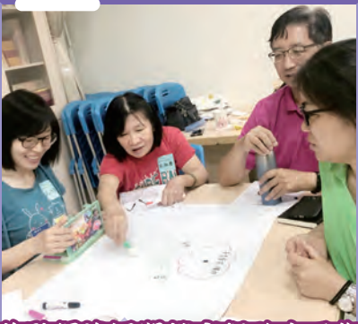
焦點解決短期諮商與助人工作