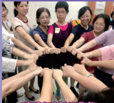
帶領人培訓結業式