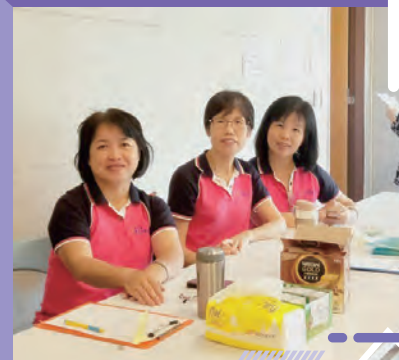
家庭教育工作推展人力培訓