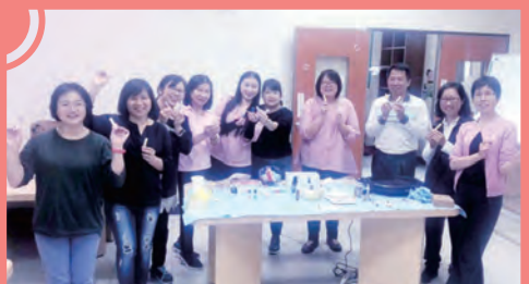
志工團活動-DIY唇膏&護唇膏教學