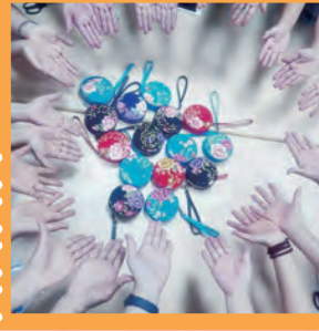
花布圓形萬用零錢包手作

因為愛，我們一起學習； 因為學習，讓我們更相愛。 在愛的旅程上， 因為有陪伴，所以不孤單； 因為有支持，所以不放棄。 讓我們這一群志願服務的園丁， 認真愛自己，努力服務需要的人。