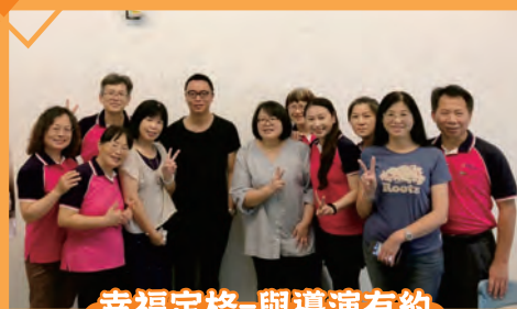
幸福定格-與導演有約