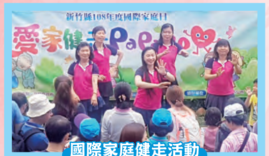
國際家庭健走活動