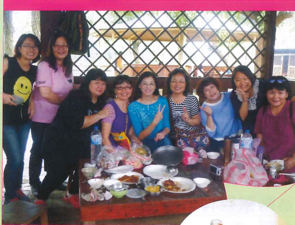
北埔麥克田園志工交流活動